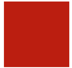
RAL 3020 | Traffic Red