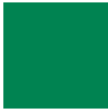
RAL 6024 | Traffic Green