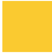
RAL 1018 | Zinc Yellow