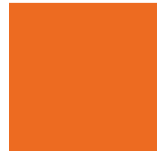
RAL 2008 | Bright red Orange