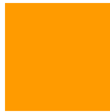
RAL 1028 | Melon Yellow