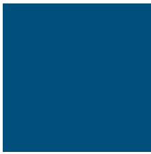
RAL 5010 | Gentian Blue