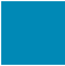
RAL 5012 | Light Blue